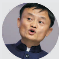
Jack Ma Alibaba Group

For ecommerce, the most important thing is trust.